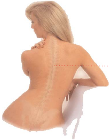
Drei Zonen-Liegefläche für Rücken- und Seitenschläfer!

Perfekt angepasste Matratze für schmerzfreies Schlafen